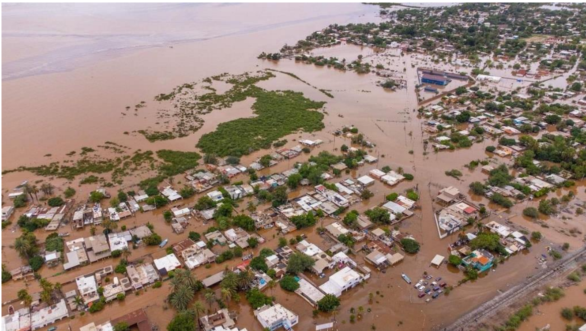
Figura 3 Inundación en Sonora, México