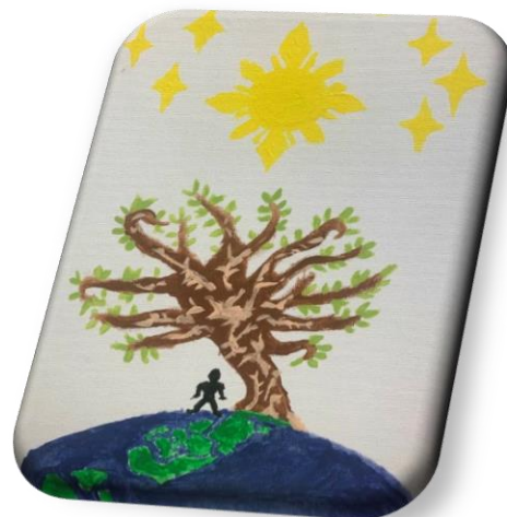
Imagen 2. “Aquí están todas las cosas que estás preguntando”. Respondió en ese tono tan avisado mostrando esta pintura.

Al final los títulos nos permiten organizar documentos que deben ser presentados en migración, espero que también, nos ayuden a comprender realidades de lo que significa emprender un largo proceso en la búsqueda de asilo, “ hay que integrarse a la cultura, porque al menos en mi caso...yo pedí asilo, yo no pido refugio, yo pido asilo y es porque hasta que la dictadura de la Habana de Cuba no cambie yo no puedo volver, no puedo regresar a mi patria, yo