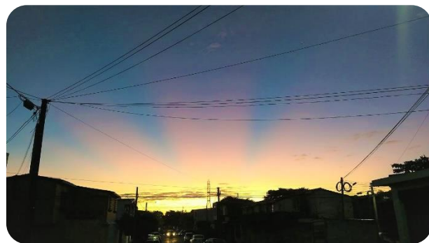
Imagen 1. Este fue el último amanecer que vi desde la entrada de mi casa en La Libertad, El Salvador.

Luego de siete años llegó el turno de mis hermanos que viajaron para reunirse con mis padres. No puedo describir lo devastada que me sentía ese día. “El sueño americano” me había robado todo. Me quedaba